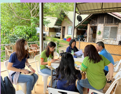
บ้านฟ้าสวย