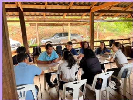
บ้านป่าเกี๊ยะใหม่